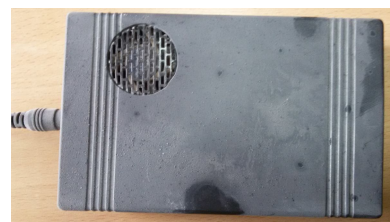
Рис. 1. Электростатический прибор ГВ-1

Для исследования влияния электростатического поля на скорость осаждения ОА внутрь объекта был помещен разработанный электростатический прибор ГВ-1 (рис. 1) с электростатическими пластинами общей площадью 12032мм 2 , на которые подавалось напряжение 20кV.