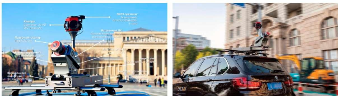
Рис. 1. Система мобільного лазерного сканування Alfa 3D, що встановлена на даху автомобіля.

Для вирішення поставлених в дослідженні завдань, на початковому етапі, для отримання даних виконувалося МЛС за допомогою скануючої системи Alfa 3D, яка була встановлена на даху автомобіля підвищеної прохідності. Ця скануюча система включає в себе наступне обладнання: лазерний сканер, панорамний камеру HDR, GNSS-приймач і високоточний IMU-датчик (рис. 1).