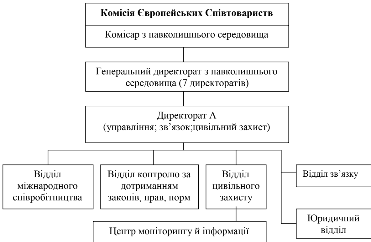
Рис.2. Структурні підрозділи КЄС з питань цивільного захисту

За розвиток і реалізацію політики Євросоюзу у галузі цивільного захисту відповідає Відділ цивільного захисту (ВЦЗ) Генерального директорату з навколишнього середовища КЄС. Генеральний директорат з навколишнього середовища КЄС, яким керує комісар ЄС, складається з 7-ми директоратів (рис. 2). ВЦЗ і Центр моніторингу та інформації (далі – ЦМІ) КЄС, що знаходиться в його розпорядженні, структурно знаходяться в Директораті А вищеназваного Гендиректорату. За штатним розкладом в ВЦЗ КЄС входять 50 співробітників з різних країн ЄС.