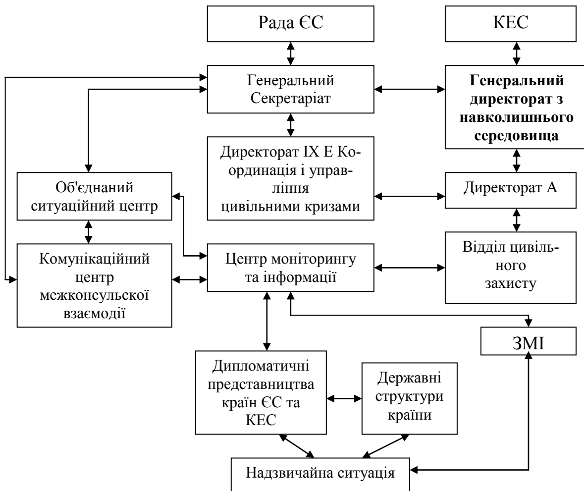
Рис. 3. Взаємодія структур ЄС при реагуванні на природні й техногенні катастрофи і евакуацію громадян ЄС при кризах

2002 р. або 0,6% валового національного доходу країни. Країни ЄС, сусідні з постраждалою країною, чи країни-кандидати в ЄС, які постраждали від цієї ж катастрофи, теж можуть отримати допомогу, навіть якщо заподіяна ним шкода не досягла вищезазначеного порога.