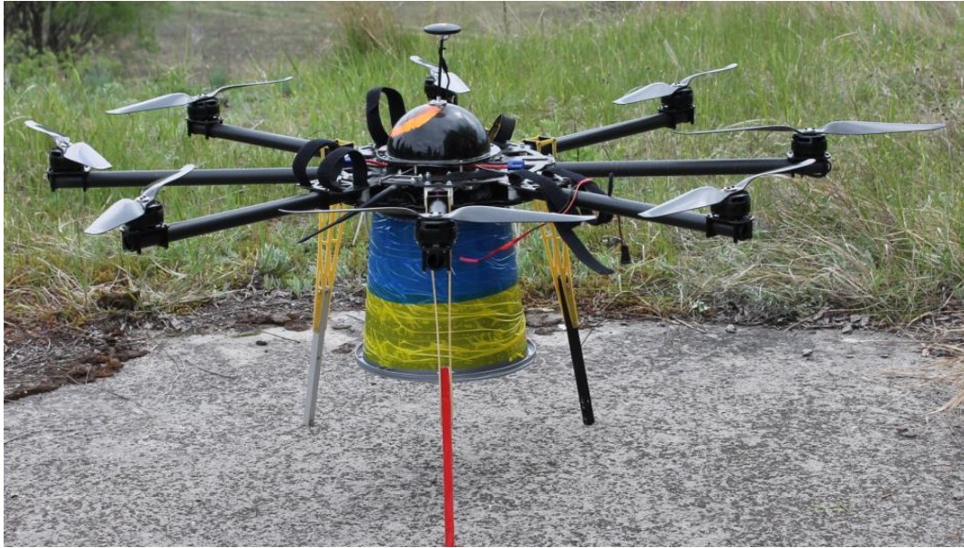
Рис. 1 – Зовнішній вигляд лабораторної установки перевірки адекватності математичної моделі запобігання НС, викликаним пожежами радіоактивних лісових масивів

Методика проведення експериментів з використанням лабораторної установки передбачала наступний порядок дій.