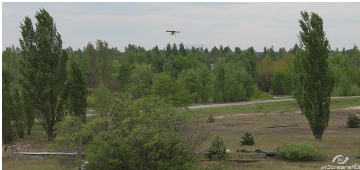
Рис. 3. – Робота запропонованої лабораторної установки

Потім лабораторна установка піднімалася в небо і починала політ, як показано на рис. 3.