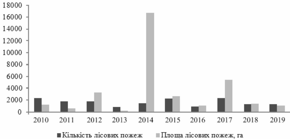
Рисунок 1 – Динаміка площ та кількості лісових пожеж за 2010-2019 роки.

засобів є актуальним питанням, яке потребує вирішення.