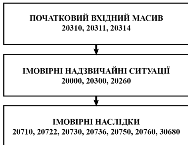
Рисунок 2 – Древо можливого розвитку подій під час і після повені

Масив імовірних НС природного характеру формують події пов’язані з підвищенням рівня ґрунтових вод (підтопленням), зсувом, обвалом або осипом, осіданням (проваллям) земної поверхні, карстовими провалами.