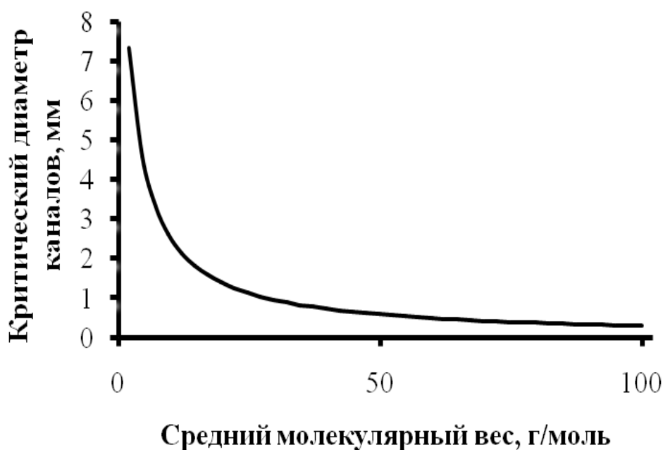
Рис. 1. Зависимость критического диаметра каналов огнепреградителя от среднего молекулярного веса воздуха

Постановка задачи и ее решение. Рассмотрим, как будет меняться критический диаметр канала с изменением в среднем молекулярном весе воздуха. Первое, определим общую тенденцию зависимости критического диаметра каналов огнепреградителя от среднего молекулярного веса воздуха (рис. 1.).