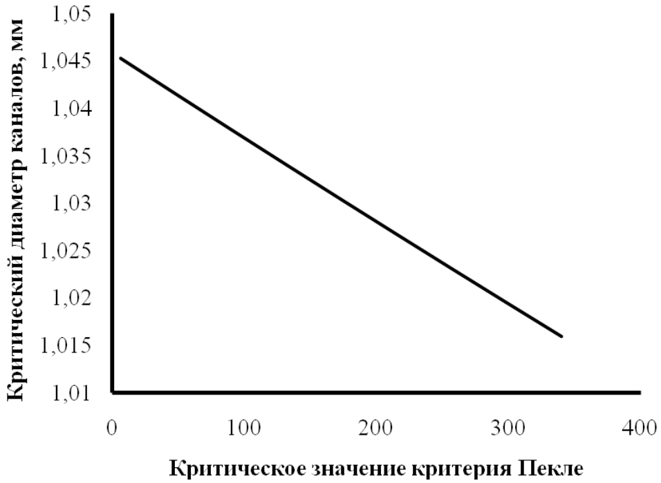
Рис. 3. Зависимость диаметра каналов от значений критерия Пекле

Тенденции в изменении верхнего и нижнего доверительных интервалов с изменением критического значения критерия Пекле представлены на рис. 4.