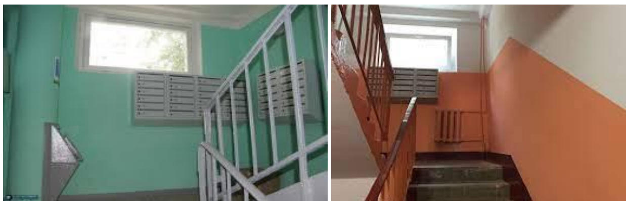
Рис. 1. Розміщення у під'їзді житлового будинку вікон сходових кліток та пристроїв для їх відчинення, на висоті яка не дозволяє вільному відкритті вікон

Аналізуючи вимоги нормативного документа [4], виникає питання щодо розміщення пристроїв для відчинення вікон з рівня сходових площадок, маршів для сходових кліток типу СК1. Відсутність визначення конкретної висоти розміщення пристроїв для відчинення вікон призводить до влаштування їх (на етапі будівництва) на завищеній висоті, – як наслідок, в подальшому унеможливорює вільне та оперативне відчинення (рис. 1). Кожна людина, незалежно від свого зросту, повинна вільно відчиняти вікна для провітрювання від диму чи можливого омивання. Погіршена видимість та задимленість сповільнює евакуацію людей, а інколи її проведення стає зовсім неможливим.