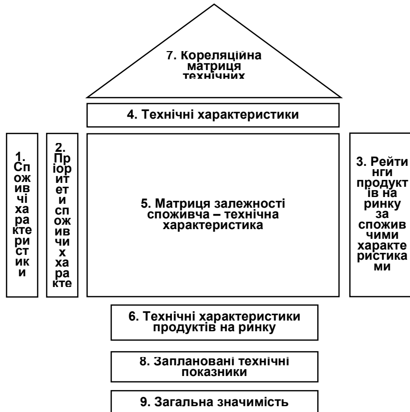
Рис. 1. Графічне представлення результатів QFD – «Будинок якості» [10]

На наш погляд, для сфери проектів/програм місцевого розвитку процес «структурування-розгортання» функції якості (QFD Process) має складатися з поступового формування чотирьох матриць: