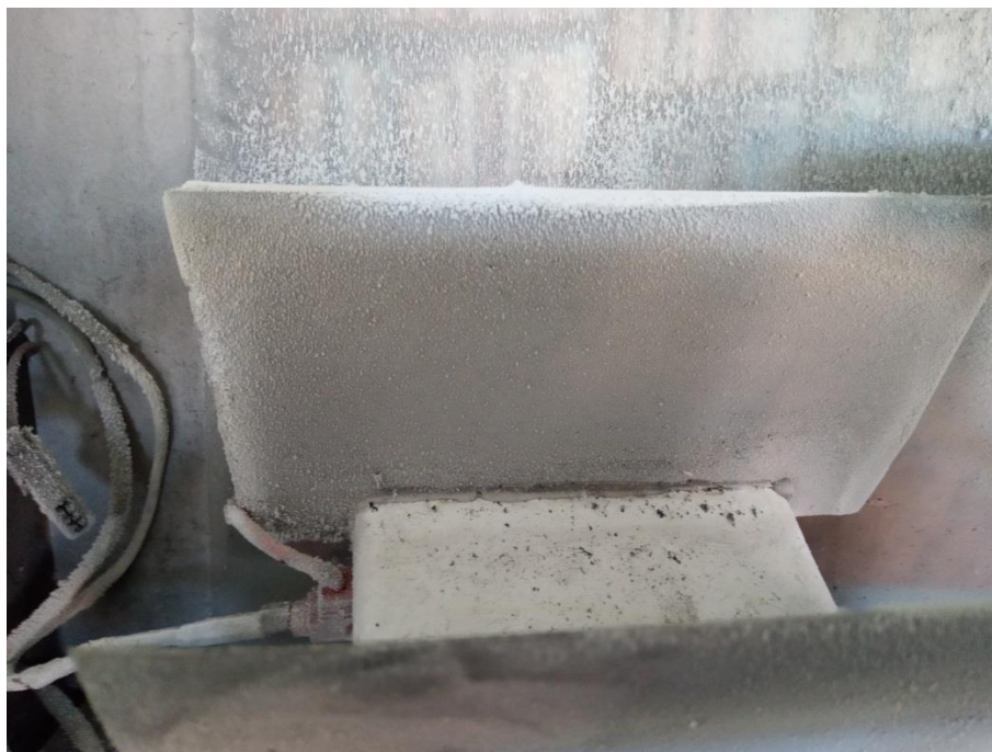
Рисунок 2 – Нерівномірний розподіл осілих твердих часток по площі пластин-електродів

Для встановлення основних закономірностей впливу електростатичного поля на швидкість осадження пилу необхідно продовжувати дослідження у обраному напрямку. При цьому, виходячи з результатів експериментальна установка потребує вдосконалення – забезпечення рівномірного пилу вздовж всієї поверхні пластин. Таке вдосконалення не потребує значних капіталовкладень та принципових змін у конструкції.