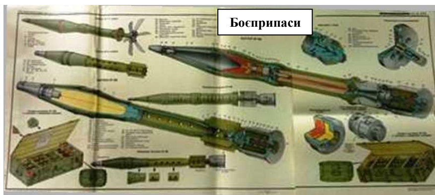
Рисунок 1 – 73 мм гранатометні постріли ПГ-15В (7ПЗ)

Пропонує конкретну технологію розрядження 73-мм пострілів ПГ-15В (інд. 7ПЗ) до 2А28, із закінченим терміном зберігання, шляхом їх розбирання на елементи. ПГ-15В особливо недоцільно утилізувати методом підриву.