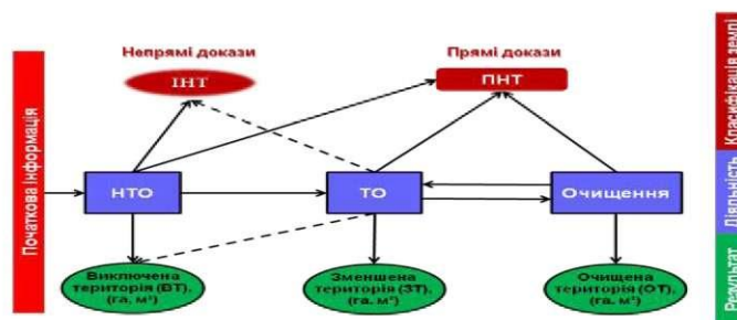
Рис. 1. Функціональна модель, яка описує процеси обстеження та очищення (розмінування) територій, забруднених ВНП.

Перше та дуже важливе завдання , яке виникає в ході очищення від ВНП імовірно небезпечних територій, площею S_{НПТ} – це нетехнічне та технічне обстеження цих територій [2,3], що, за результатами отримання непрямих та прямих доказів, дає можливість розподілити загальну площу на дві категорії – підтверджено небезпечні території площею S_{ПНТ} , забруднені ВНП, та виключені або зменшені території площею S_{В(з)Т} , на яких гарантовано відсутні ВНП (рис. 1).