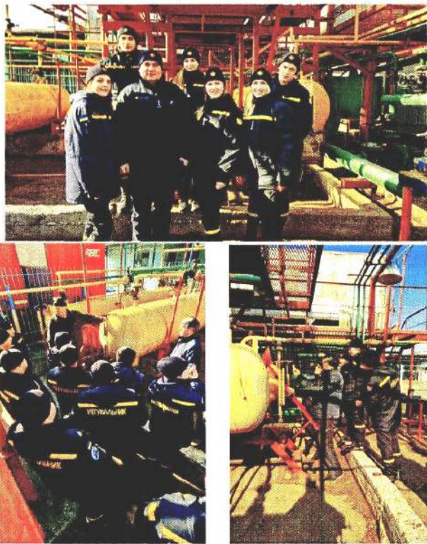
Рис. 1 – Вийзне заняття на території підприємства «База ОПС–Черкаси тарн»