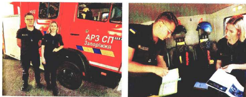
Рис. 4 – 3 02 по 06 жовтня 2023 року тривало відрядження до ГУ ДСНС України у Запорізькій області представників НУЦЗ України

Розроблена на кафедрі система навчальних курсів працює на випередженні, оскільки розвиває грамотного фахівця-хіміка зі специфікою протидії надзвичайним ситуаціям, що необхідно в більшості галузей промисловості. Це й аварійні розливи хімічно активних речовин, і утворення вибухонебезпечних сере-