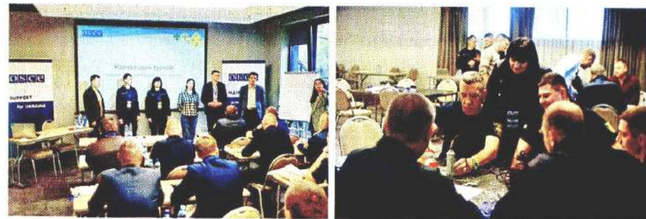
Рис. 3 – Тренінг з основ реагування на радіаційні загрози для профільних співробітників ДСНС та ДПСУ в межах проекту «Посилення спроможності України щодо реагування на надзвичайні ситуації, пов'язані з небезпечними хімічними речовинами»

Якість освіти на кафедрі забезпечується висококваліфікованим науково-педагогічним персоналом, який постійно підвищує свою кваліфікацію, бере участь у спільних навчаннях з фахівцями країн Європейського союзу, співпрацює із практичними підрозділами та стейкхолдерами, а також виступають учасниками тренінгів, організованих у межах реалізації Програми підтримки ОБСЄ для України.