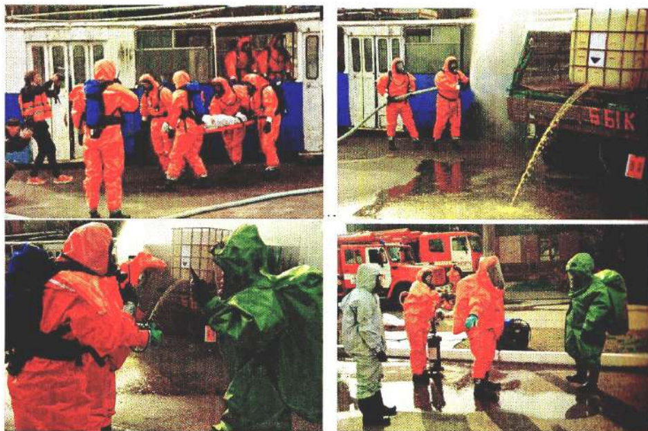
Рис. 7 – Протягом триденного тренінгу понад 40 фахівців підрозділів ДСНС з радіаційного, хімічного та біологічного захисту були учасниками соціально-психологічного тренінгу «Відпрацювання технік взаємодії з постраждалими з різними психологічними моделями поведінки внаслідок надзвичайних ситуацій, пов'язаних із небезпечними хімічними речовинами»

Місії США в ОБСЄ та Федерального міністерства закордонних справ Німеччини у взаємодії з Міністерством внутрішніх справ України та Державною службою України з надзвичайних ситуацій курсанти НУЦЗ України та фахівці підрозділів ДСНС з радіаційного, хімічного та біологічного захисту відпрацювали дії пожежно-рятувальних підрозділів під час реагування на інцидент із небезпечною хімічною речовиною, включаючи евакуацію потерпілих, блокування витоку речовини, знезараження персоналу та цивільного населення.