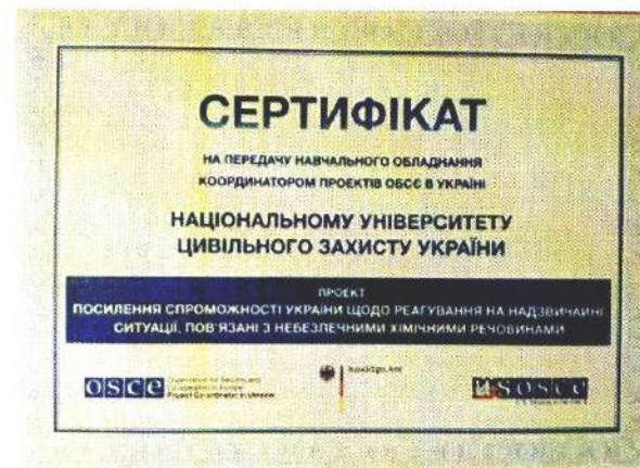
Рис. 6 – У рамках проєкту міжнародної технічної допомоги представники ОБСЄ в Україні передали до Національного університету цивільного захисту України спеціальне навчальне обладнання для відпрацювання навичок роботи рятувальників під час ліквідації надзвичайних ситуацій з викидом небезпечних хімічних речовин

Для посилення спроможності Державної служби України з надзвичайних ситуацій (ДСНС) готувати рятувальників, задіяних у реагуванні на надзвичайні ситуації хімічного характеру, Координатором проєктів ОБСЄ в Україні розроблено Рекомендації до розроблення модульної навчальної програми для осіб молодшого, середнього та старшого начальницького складу ДСНС, які беруть участь в реагуванні на події, пов'язані з небезпечними хімічними, радіоактивними і біологічними речовинами (РХБ), надано обладнання для проведення практичних навчань, організовано ряд інтенсивних теоретичних та практичних тренінгів для співробітників спеціалізованих РХБ підрозділів ДСНС, де науково-педагогічний склад кафедри брав безпосередню участь.