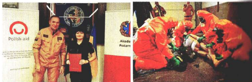
Рис. 5 – 3 18 до 22 вересня 2023 року в м. Варшава, Республіки Польща, відбулись спеціалізовані навчання в рамках реалізації проєкту «Підтримка Державної служби України з надзвичайних ситуацій у випадку РХБЯ загроз»

Кафедра спеціальної хімії та хімічної технології приділяє значну увагу удосконаленню навчально-методичного та наукового потенціалу, розвитку та розширенню міжнародних зв'язків у сфері радіаційного та хімічного захисту. Чудову можливість покращити навчальний процес надала співпраця ДСНС з різними міжнародними організаціями, а саме: НАТО, Організацією заборони хімічної зброї (ОЗХЗ), ОБСЄ, Федеральним відомством цивільного захисту та допомоги при катастрофах Федеративної Республіки Німеччина (ВВК), Агентством зі зменшення загроз міністерства оборони США (АЗЗ), Інтерпол.