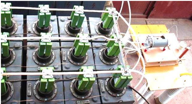
Рис. 2. Внешний вид фрагмента зарядно-разрядных цепей мощного ЕНЭ одномодульного исполнения на номинальное напряжение \pm 50 кВ и номинальную запасаемую электрическую энергию W_n=420 кДж с высоковольтными импульсными конденсаторами типа ИК-50-3 и установленными на их высоковольтных выводах защитными постоянными графито-керамическими резисторами типа ТВО-60-24 Ом [10]

На рис. 2 приведен внешний вид фрагмента зарядно-разрядных цепей мощного высоковольтного ЕНЭ одномодульного исполнения ( W_n=420 кДж; W_0=3,75 кДж) разработки НИПКИ “Молния” НТУ “ХПИ” с жестко установленными на высоковольтных выводах их конденсаторов типа ИК-50-3 ( n=112 ; k=4 ; N_3=448 ) защитными графито-керамическими резисторами типа ТВО-60 номиналом R_{03}=24 Ом ( W_k \approx 2,5 кДж) [7,10]. Данный ЕНЭ согласно расшифровке соответствующих осциллограмм затухающего синусоидального тока в его разрядной цепи имеет собственное активное сопротивление R_C \approx 0,057 Ом [10]. Подставив в (4) и (5) соответствующие численные данные для указанного мощного одномодульного ЕНЭ ( W_0=3,75 кДж; n=112 ; k=4 ; N_3=448 ), убеждаемся, что выбранные параметры резистивной защиты высоковольтных конденсаторов этого ЕНЭ от аварийных токов удовлетворяют указанным выше критериям.