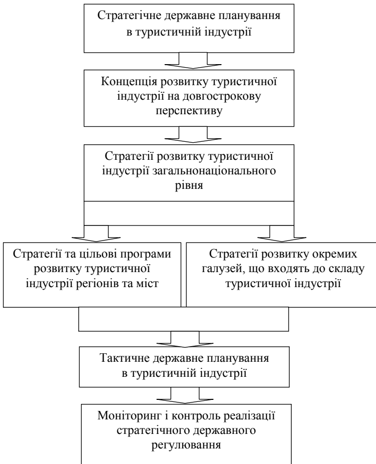
Рис. 3.1. Послідовність етапів побудови системи стратегічного державного регулювання розвитку індустрії туризму

підвищенню рівня системності заходів, що реалізуються органами державної влади в цьому контексті.