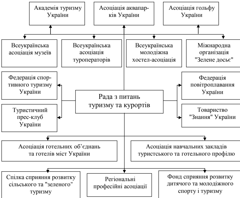
Рис. 1.1. Склад Ради з питань туризму та курортів [24]

Одеська Асоціація туроператорів і агентств; Асоціація "Туризм Одеси"; Миколаївська обласна громадська організація "Туристсько-краєзнавчий клуб "Святий Миколай""; Миколаївська обласна дитяча громадська організація "Миколаївський союз скаутів"; Миколаївський клуб мандрівників; Миколаївська обласна молодіжна громадська організація "Миколаївський обласний осередок спілки сприяння розвитку сільського зеленого туризму в Україні"; Місцева рада з питань туризму м. Миколаєва; Громадська організація "Агенція регіонального розвитку Таврійського об'єднання територіальних громад"; Херсонська обласна молодіжна громадська організація "Центр живої історії "Олешія""; Громадська організація "Громада Залізного Порту"; Херсонське обласне відділення Спілки сприяння розвитку сільського зеленого туризму в Україні; Асоціація розвитку туризму Півдня України; Генічеська районна громадська організація "АЗОВ" (Асоціація закладів оздоровлення, відпочинку) [24].