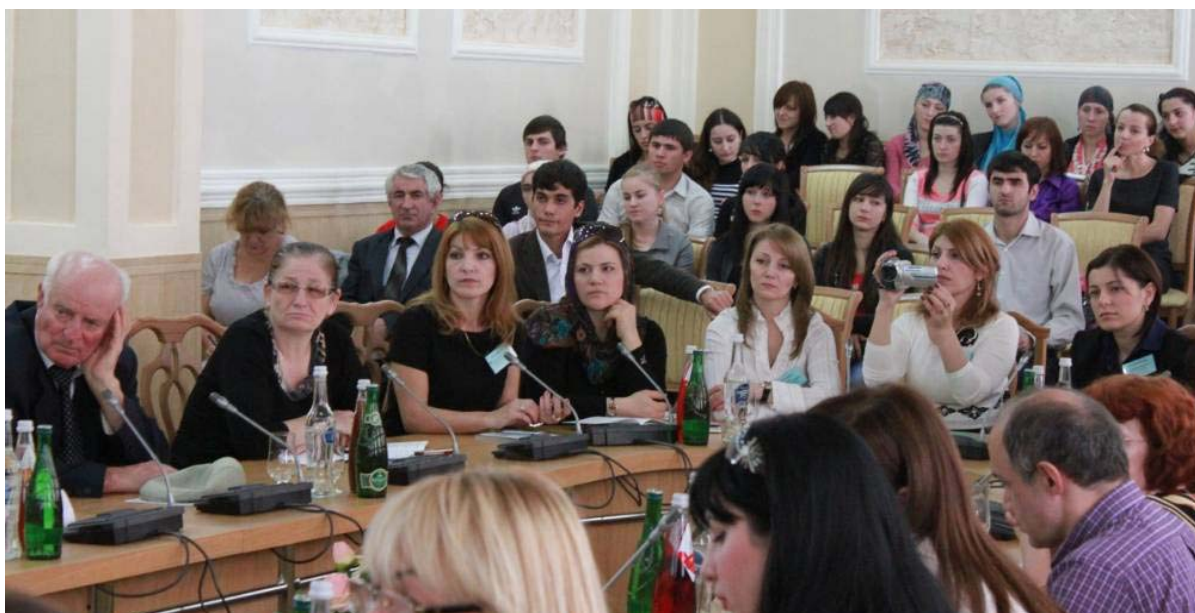
Участники конференции, преподаватели кафедры психологии ДГПУ.