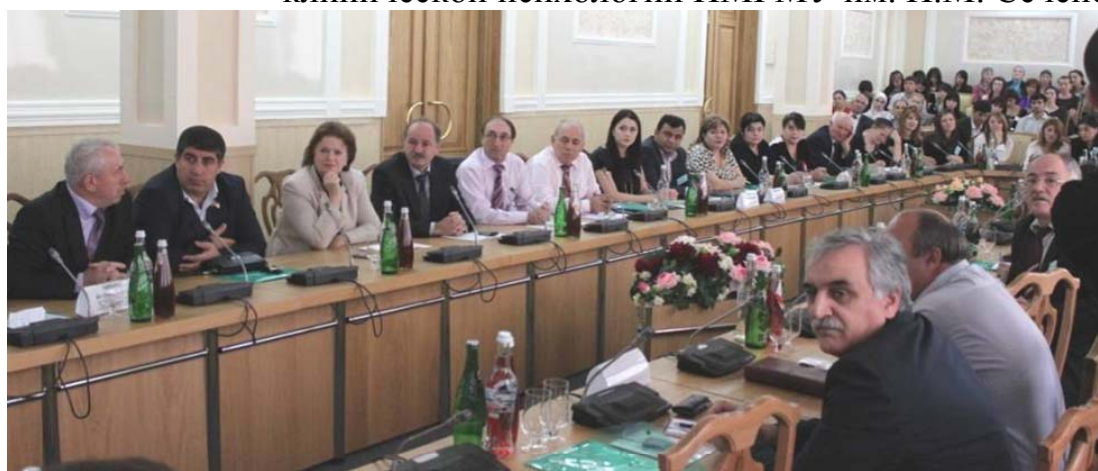
Участники конференции, профессорско-преподавательский состав ДГПУ.