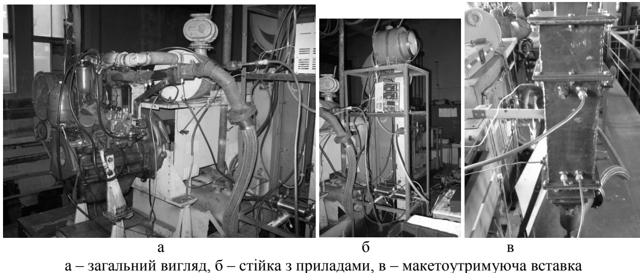
Рис. 2 – Модернізована випускна система МВС, обладнана МВ і системою відбору проб ВГ на токсичність і димність

Параметри ЗВТ стенду зведені у таблицю 1, дані у якій взято з джерел [3, 12 – 21].