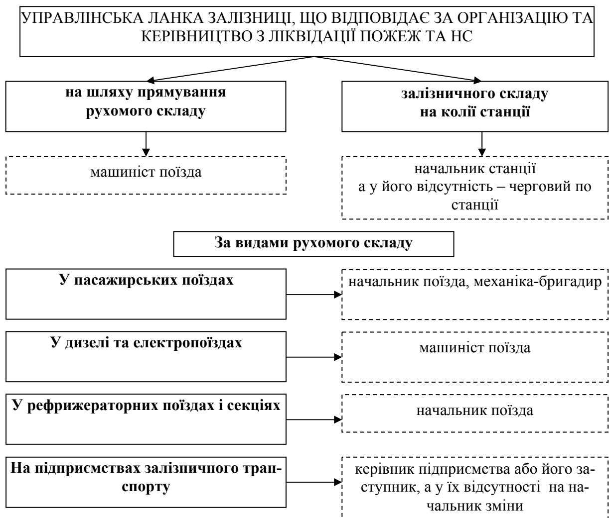
Рис. 1. Структурна схема відповідальних управлінської ланки залізниці

Виклад основного матеріалу. Відповідальність за організацію і керівництво гасінням пожеж, рятування пасажирів, евакуацію рухомого складу та вантажів до прибуття пожежно-рятувальних підрозділів ДСНС України покладається на наступних посадових осіб (рис. 1).