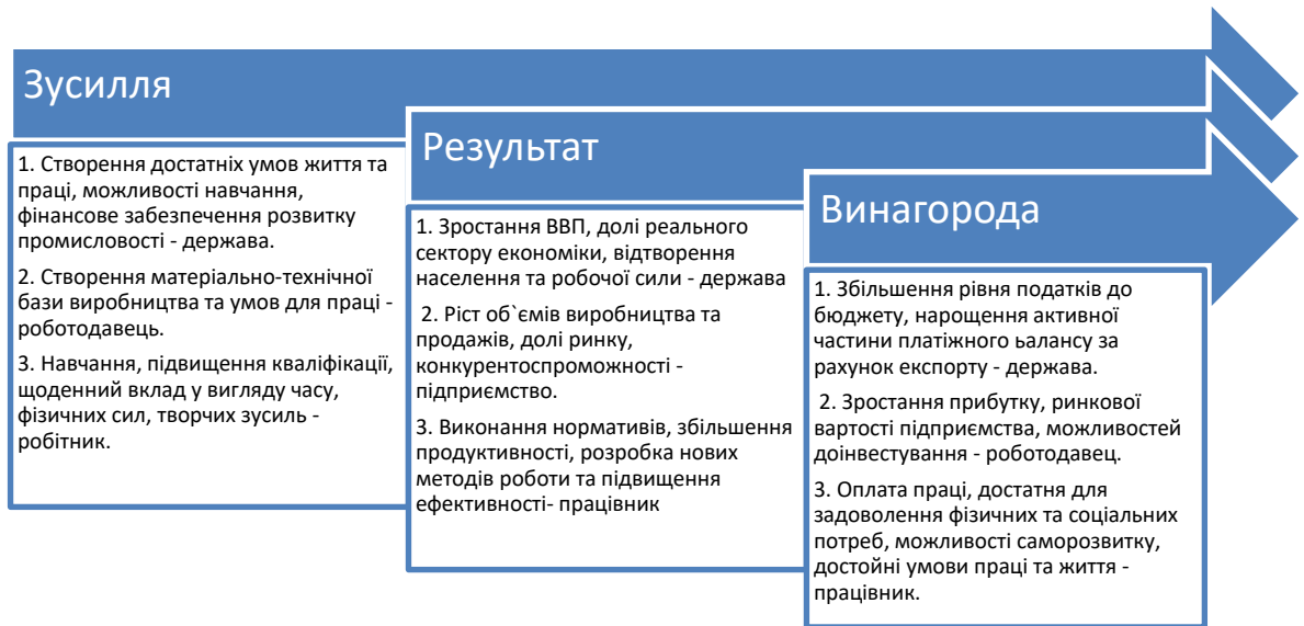
Рисунок 1. – Структура механізму мотивації праці на основі тріади «державна – підприємство - робітник»[3]

Висновки: Як ми бачимо із рисунку коло інтересів на рівні «зусилля держави та винагорода працівників» співпадають, тобто створення достойних умов життя та праці є чи не найпершою умовою для збереження відтворюючої функції розвитку кадрової забезпеченості виробничої сфери. Саме соціальний фактор відіграє основну роль при виборі місці життя та роботи людей. Збереження населення України в рамках наших кордонів, надання можливостей навчання, роботи, розвитку та реалізації творчого потенціалу призведе до розквіту економіки окремих регіонів та держави в цілому.