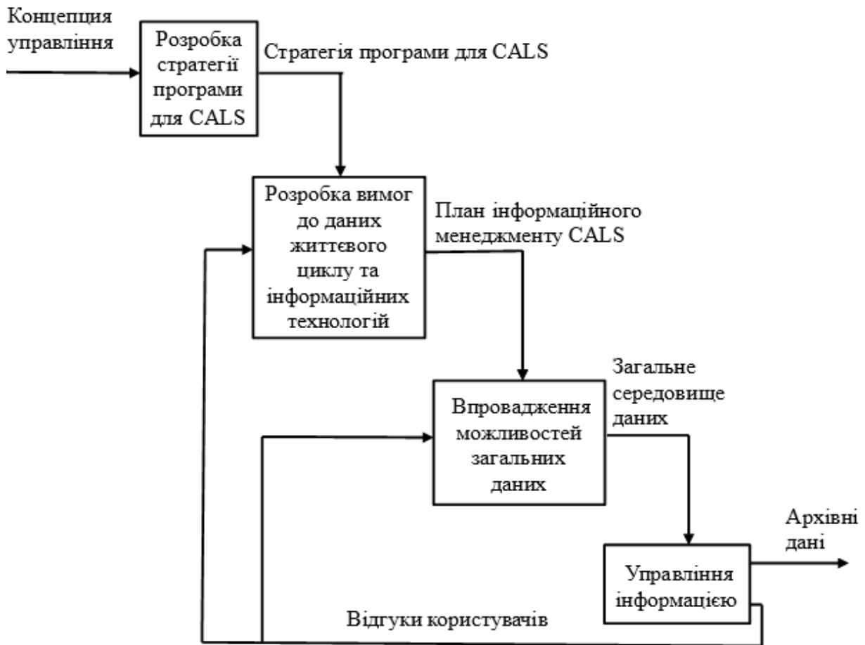
Рис. - Чотирьохетапний процес CALS для інформаційного менеджменту життєвого циклу [2]

Практичне застосування TLIM, скоріше за все, буде вимагати повторних ітерацій між цими різними етапами, оскільки розвиток розуміння проблеми дозволяє уточнити підхід [2].