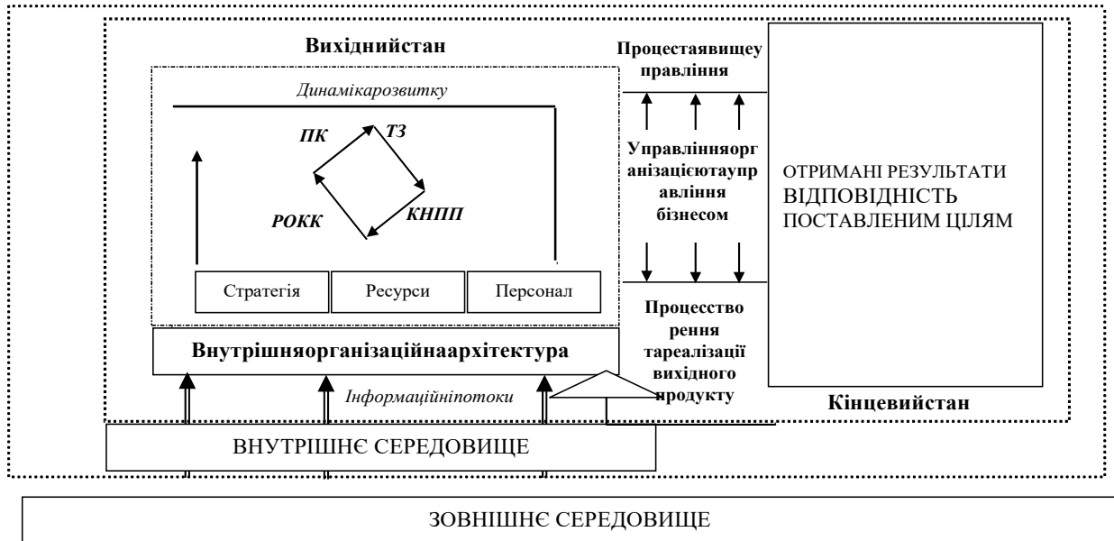
Рис. Сутність процесу управління на підприємстві

знання (ТЗ – трансформація знання), конфігурує в новий підприємницький потенціал (КНПП – конфігурація нового підприємницького потенціалу), а потім доносить, розширює та оформлює в ключові компетенції (РОКК – розширення та оформлення ключових компетенцій), це підприємство витримує конкуренцію (ПК – підвищення конкурентоспроможності), забезпечивши вчасний розвиток власного організму та подальший успіх на рівні престижу (репутації, поваги, визнання), оригінальних ноу-хау, можливості розвивати потенціал знань(рис.).