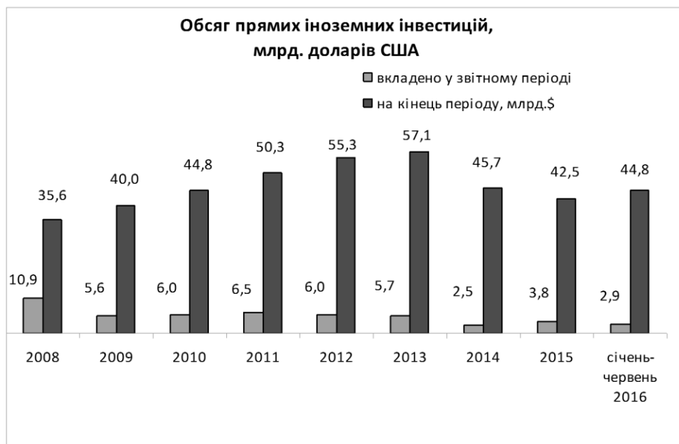
Рисунок 1 – Обсяг прямих іноземних інвестицій

За даними Держстату (рис. 1) у січні-червні 2016 року в економіку України іноземними інвесторами вкладено 2859,1 млн. дол. США та вилучено 330,1 млн. дол. США прямих інвестицій (акціонерного капіталу), у січні-червні 2015 року – 1042,4 млн. дол. США та 351,3 млн. дол. США відповідно.