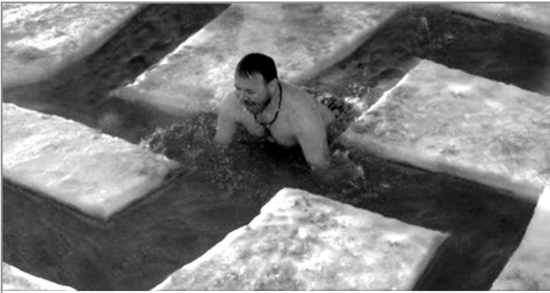
Вблизі Маріуполя полк «Азов» окунувся в Азовське море (ФОТО)

Або подивіться, як пропагандисти, використовуючи реальні фото і графічні редактори, змінюють смисл на протилежний. До речі, на реальному фото ополонка має форму православного хреста, а саме фото було зроблене в російському місті Омськ за тисячі кілометрів від зони АТО.