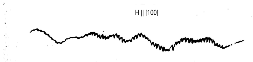
Рис. 3. Суперсверхтонкая структура спектра Mn^{2+} в кристалле йодистого натрия

натрия, активированных марганцем (с концентрацией 10^{-1} %), и сопоставлены с полученными из измерений спектров ЭПР, что позволит более достоверно установить электронную структуру активаторных центров.