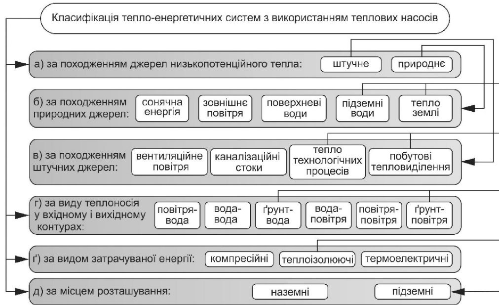
Рис. 1. Класифікації тепло-енергетичних систем з використанням теплових насосів

Чим вища вологість – тим більше тепла можна отримати. Вологий глиняний ґрунт буде мати найкращі теплові характеристики, а великий вміст піску значно зменшує кількість відібраного тепла [11].