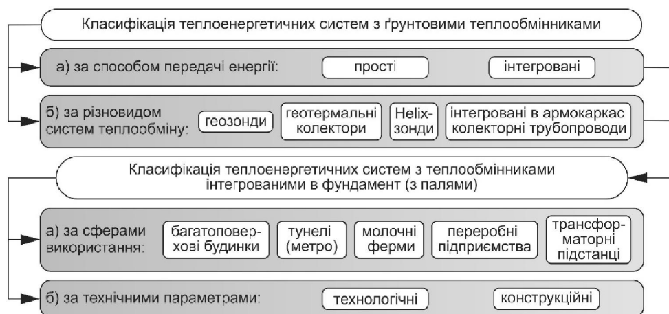
Рис. 2. Класифікація теплоенергетичних систем з ґрунтовими теплообмінниками та з теплообмінниками інтегрованими в фундамент (з палями)

Класифікація теплоенергетичних систем з теплообмінниками представлена на рис. 2.